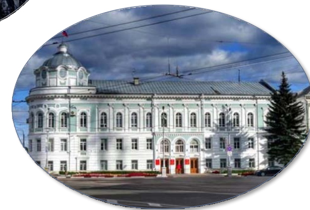
Правительство Тверской области