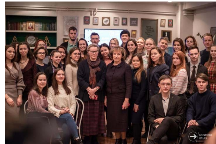
Центр студенческих инициатив