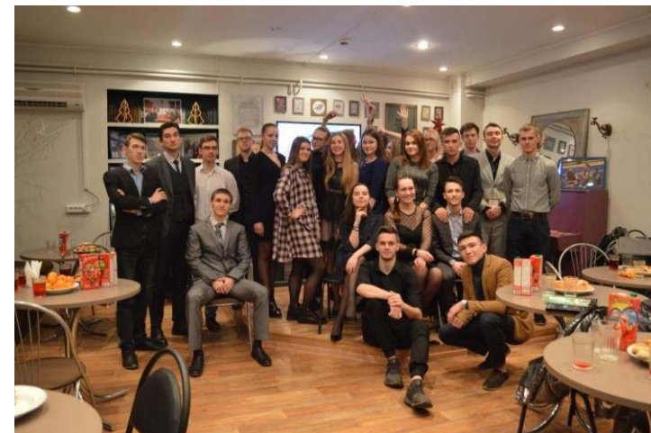
Спортивный клуб «Атлант»