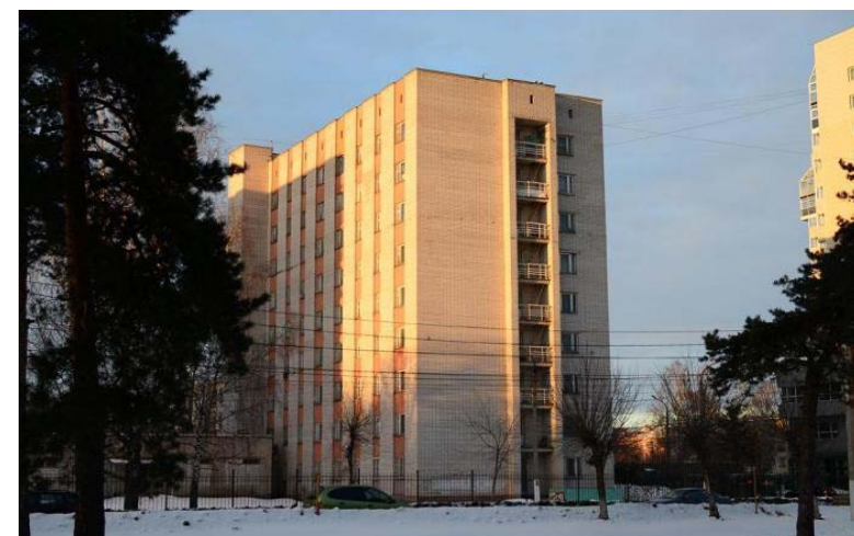
Общежитие на Спортивном переулке