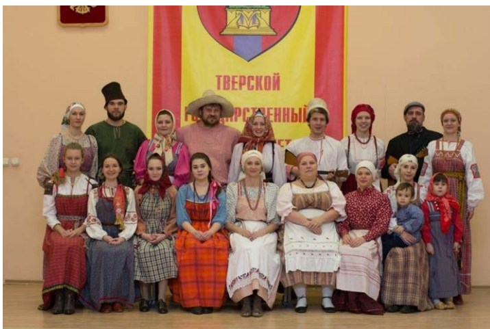
Фольклорный ансамбль «Славяночка»