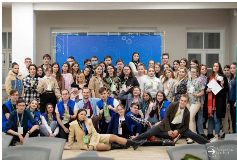
Профсоюзная организация студентов ТвГУ