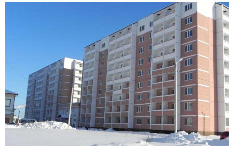
Общежитие в мкр «Соминка»